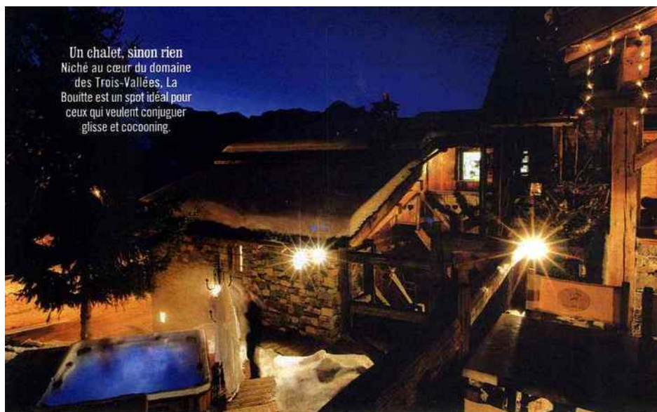
Un chalet, sinon rien Niché au cœur du domaine des Trois-Vallées, La Bouitte est un spot idéal pour ceux qui veulent conjuguer glisse et cocooning.