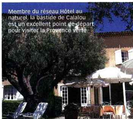
Membre du réseau Hôtel au naturel, la bastide de Calalou est un excellent point de départ pour visiter la Provence verte.

gites.outines.pagesperso-orange.fr/cles_emeraude.htm