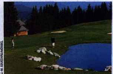
La station de Méribel fait son Golf Show en août.

Après les skieurs, les golfeurs ! Situé au pied du golf 18 trous, il propose durant le Méribel