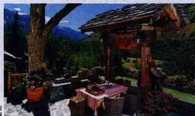
La Bergerie du Miravidi , maison d'hôtes éco-arty.

Autre tendance annoncée : cet été, montagne rime avec cheval. A La Bergerie du Miravidi (06.23.34.75.59 ; www.bergeriedumiravidi.com ), la maison d'hôtes arty et éco-friendly de