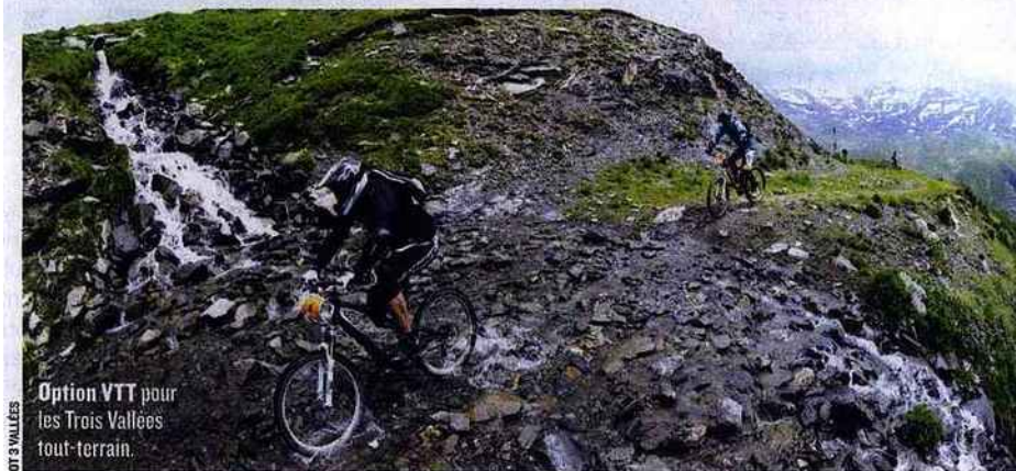
Option VTT pour les Trois Vallées tout-terrain.

Après les sports d'hiver, les sports d'été. Avec la randonnée, le VTT demeure l'une des activités phares de la montagne verte. Les mordus se retrouveront dans les 3 Vallées sur ses 600 km de pistes, pour la 12 e édition des Trois Vallées