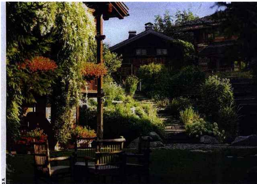
Détox et vitalité à l'honneur aux très chics Fermes de Marie à Megève.

Dans cet esprit dynamique, les Fermes de Marie (04.57.74.74.74 ; www.fermesdemarie.com ) lancent une série de cures « réénergisantes » baptisées « Healthy Lifestyle - Détox et Vitalité ». Tout un programme de remises en forme globales axées sur une hygiène de vie plus saine incluant l'alimentation, les soins cosmétiques et un certain nombre d'activités physiques (sport, yoga, tai-chi, etc.), sous la houlette des nouveaux gourous de la forme. Objectif détente et ressourcement, dans un lieu shabby chic . Les bobos sont fans ! Du 26 juin au 3 septembre, à partir de 1 930 € la semaine par personne.