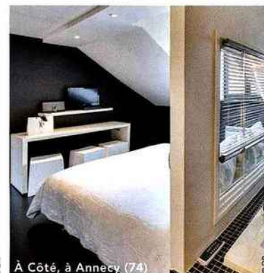
À Côté, à Annecy (74)

La France compte 37 500 maisons d'hôtes soit 75 000 lits.