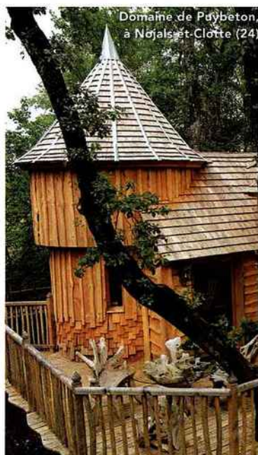
Domaine de Pdybeton, à Nojals-et-Clotte (24)

La France compte 37 500 maisons d'hôtes soit 75 000 lits.