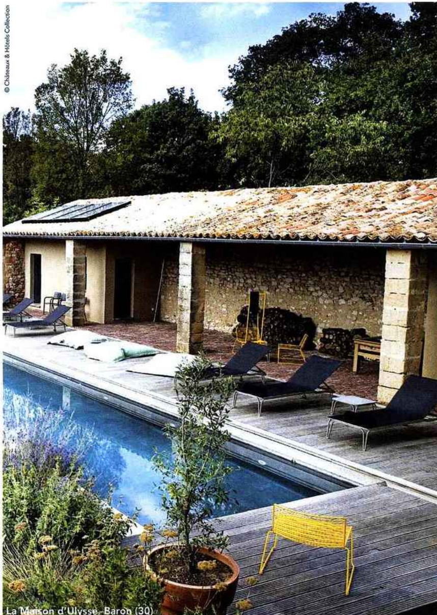
La Maison d'Ulysse, Baron (30)

Une maison de collectionneur pour les amoureux de l'Art dans tous ses états! Atmosphère pop et baroque. À partir de 166 €.