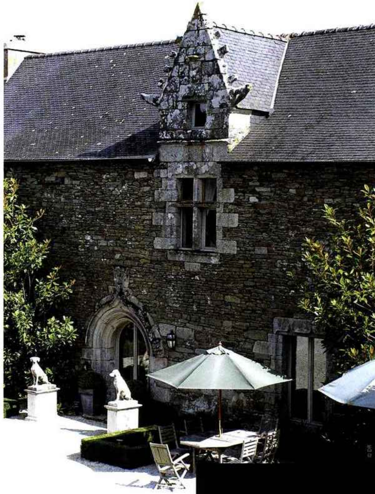
Le Manoir de Kerlédan, Carhaix-Plouger (29)